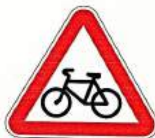
«Пересечение с велосипедной дорожкой»