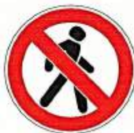
«Движение пешеходов запрещено»