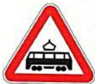
«Пересечение с трамвайной линией»