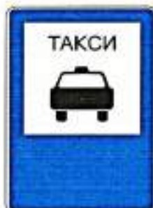
«Место стоянки легковых такси»