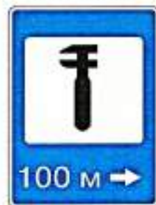
«Техническое обслуживание автомобилей»