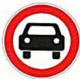
«Движение механических транспортных средств запрещено»