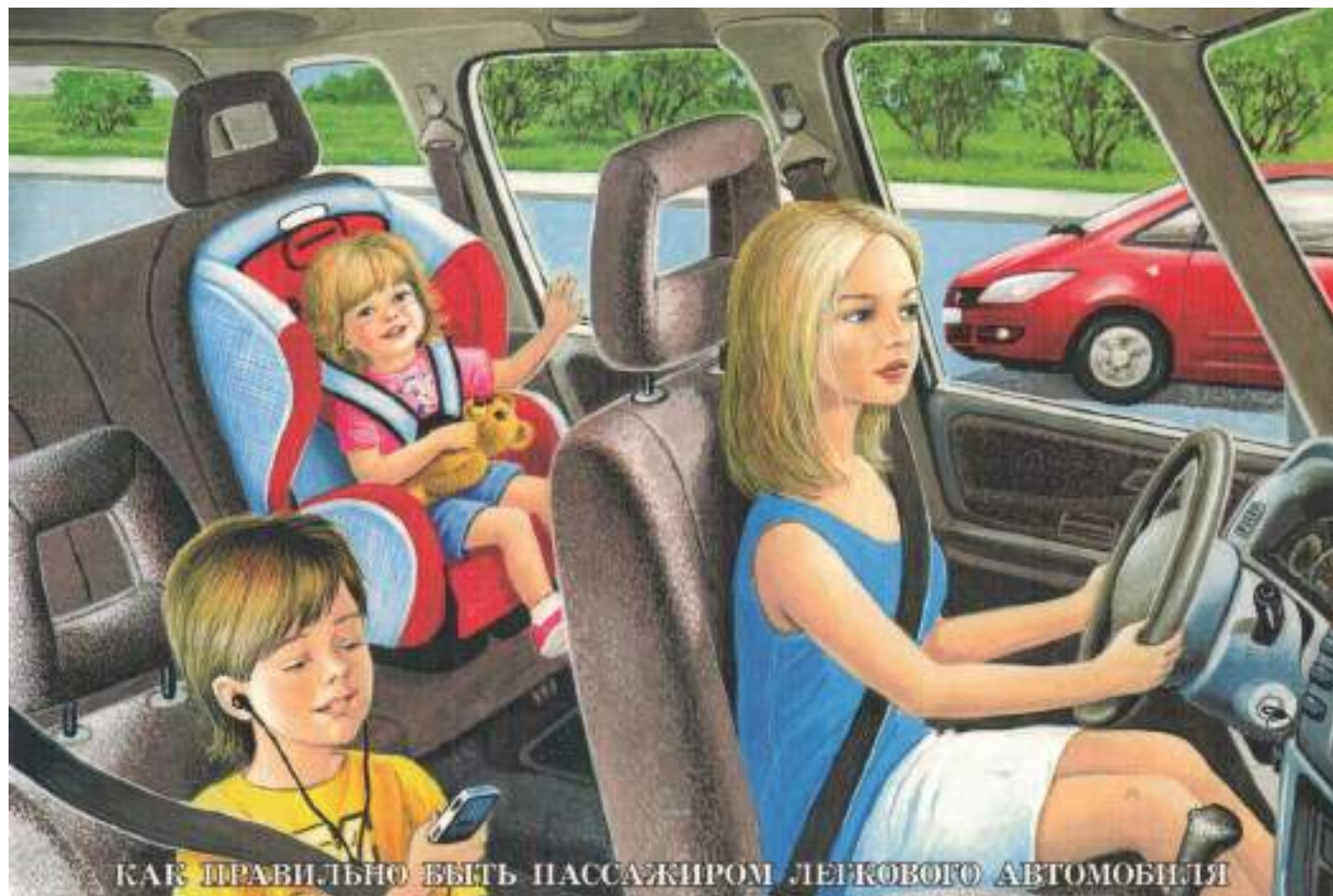
КАК ПРАВИЛЬНО БЫТЬ ПАССАЖИРОМ ЛЕГКОВОГО АВТОМОБИЛЯ

Когда посадка закончится, не выходите из машины на проезжую часть. Выходить нужно только на тротуар.