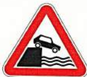
«Выезд на набережную»