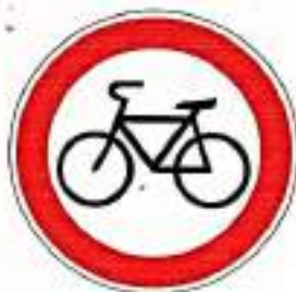
«Движение на велосипедах запрещено»