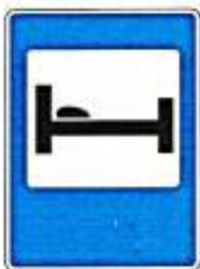
«Гостиница или мотель»