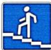
«Надземный пешеходный переход»