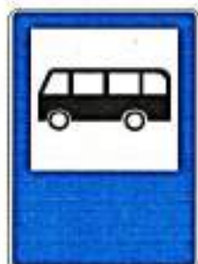
«Место остановки автобуса и (или) троллейбуса»