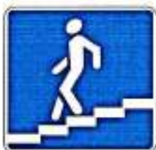
«Подземный пешеходный переход»