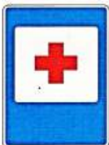
«Пункт первой медицинской помощи»