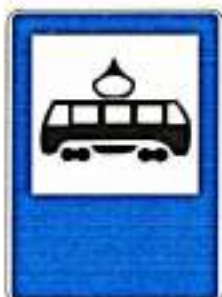
«Место остановки трамвая»